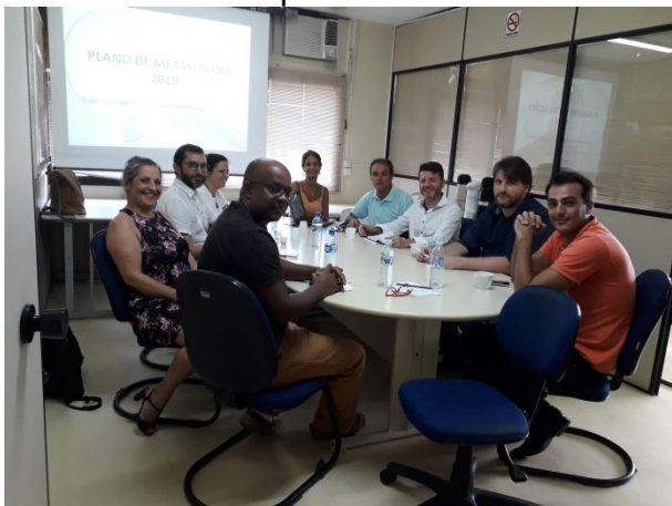
Encontros com a CGU ocorreram na STC

Já na quinta-feira, dia 31, a reunião foi com o Superintendente da Transparência e Controle e os demais técnicos para tratar de assuntos ligados a Transparência Pública. Na oportunidade a CGU colocou-se a disposição para parcerias através de cursos e seminários com objetivo de orientar os gestores e servidores municipais.