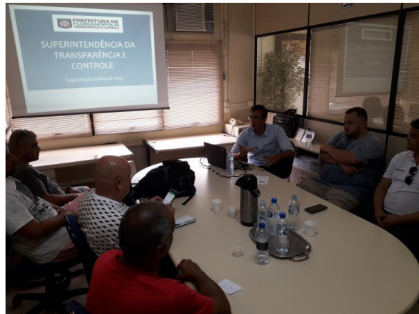
Orientação ocorreu na sala de reuniões da STC

A Superintendência da Transparência e Controle realizou na tarde do dia 03 de janeiro, uma orientação com representantes das Escolas de Samba de Florianópolis, com o objetivo de orientar, conforme a legislação, a correta utilização dos recursos públicos repassados para o Carnaval 2019 e sua posterior apresentação da prestação de contas.