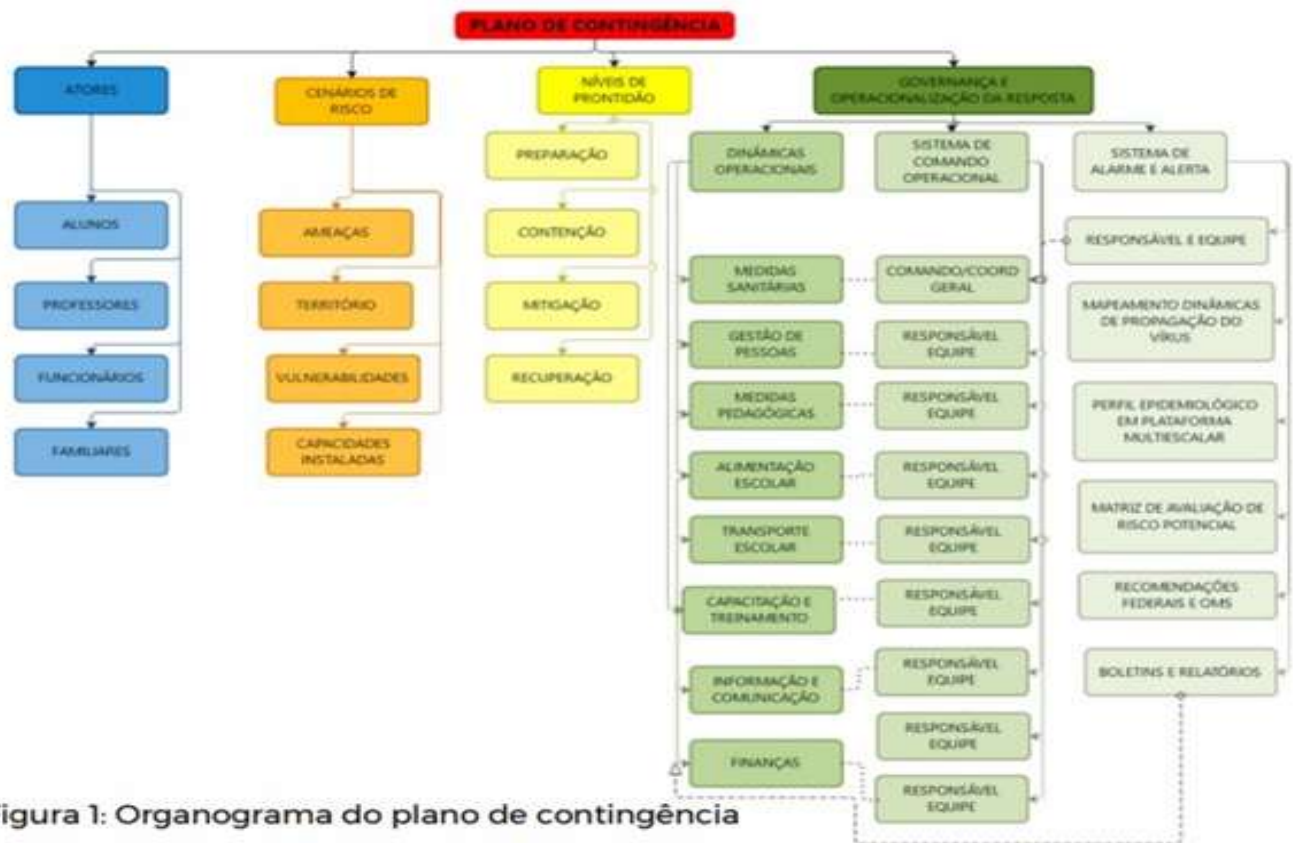
Figura 1: Organograma do plano de contingência