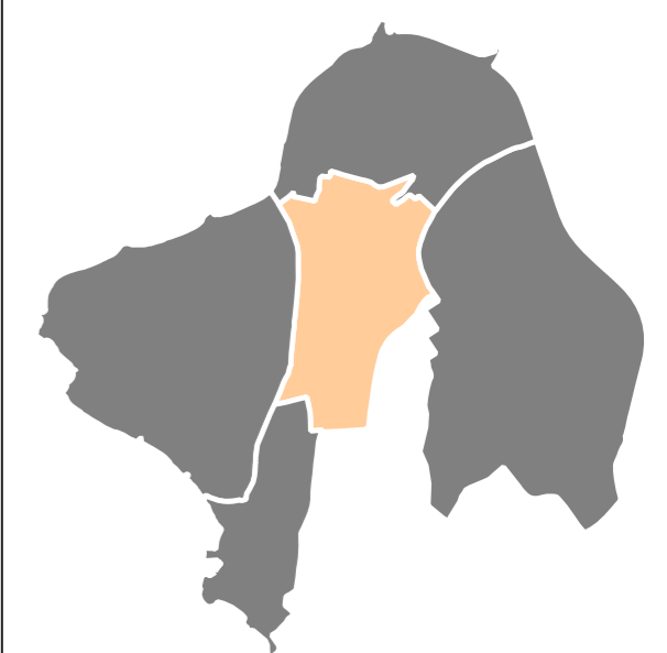
Localização do Centro de Saúde Monte Serrat