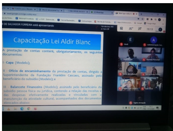
Treinamento foi realizado virtualmente

A SMTAC entende que a orientação prévia dos beneficiários para a correta utilização dos recursos é uma fundamental ferramenta de controle visando a adequada destinação dos valores. Este trabalho de orientação realizado em parceria com as unidades gestoras foi realizado em vários temas durante todo o exercício de 2020.