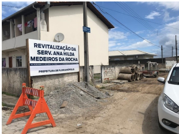
Obras da servidão Ana Hilda Medeiros da Rocha

A Secretaria Municipal de Transparência, Auditoria e Controle (SMTAC) realizou, no dia 09 de dezembro, uma visita de monitoramento as obras de execução de pavimentação e drenagem da Servidão Ana Hilda Medeiros da Rocha, no bairro do Campeche.