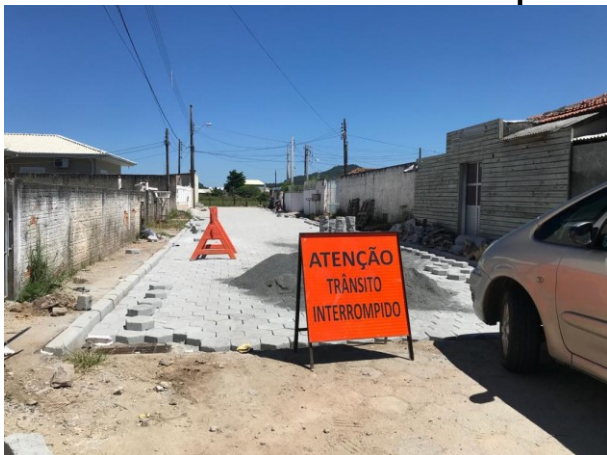
Obras receberam novas visitas do Controle Interno

A Secretaria Municipal de Transparência, Auditoria e Controle (SMTAC) realizou nos dias 18 e 26 de fevereiro, duas novas visitas de fiscalização e monitoramento as obras de pavimentação e drenagem da Servidão Ana Hilda Medeiros da Rocha, no bairro do Campeche.