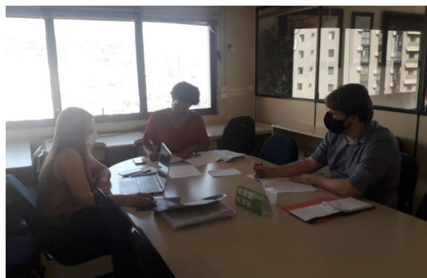
SMTAC trabalha na atualização de Decreto da LAI

O grupo de trabalho seguirá se reunindo até a conclusão da minuta, que deverá ser apresentada como proposta de alteração ainda no início de 2021.