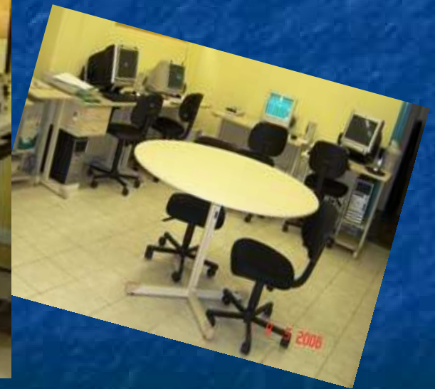
Núcleo de Produção Braille