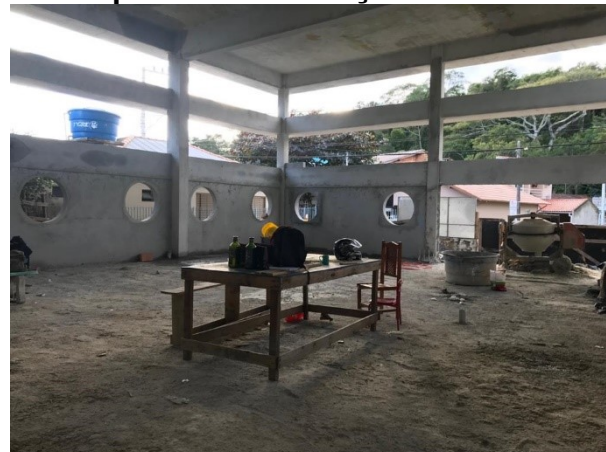
SMTAC acompanha obras de escola em Jurerê

No dia 9 de julho a Secretaria Municipal de Transparência, Auditoria e Controle realizou nova visita de acompanhamento as obras de reforma e ampliação do Núcleo de Escola Básica Municipal Jurerê, localizado na Rua Jurerê Tradicional.