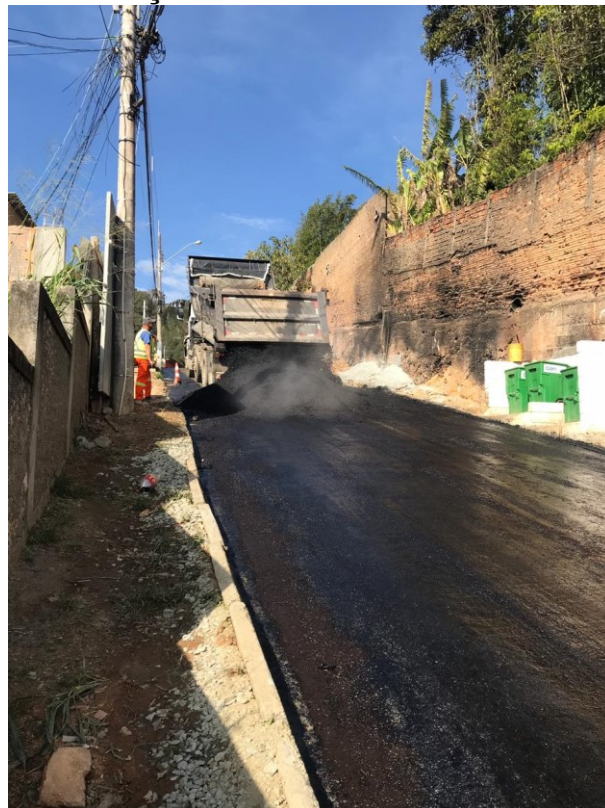
SMTAC visita obras na Rua João Carvalho

No dia 23 de julho a Secretaria Municipal de Transparência, Auditoria e Controle realizou nova visita as obras de revitalização e recuperação asfáltica da Rua João Carvalho, no bairro Agrônômica. Como em todas as visitas de monitoramento o fiscal de contrato de obras, neste caso da Secretaria Municipal da Infraestrutura, acompanhou a visita.