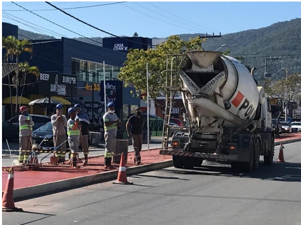
SMTAC já realizou cinco visitas as obras

Durante o mês de julho a Secretaria Municipal de Transparência, Auditoria e Controle realizou novas visitas de monitoramento as obras de recuperação asfáltica e revitalização da Avenida Madre Benvenuta, localizada entre o bairro Santa Mônica e o bairro Trindade, ao todo, até este momento, já foram realizadas um total de cinco visitas do Controle Interno as obras.