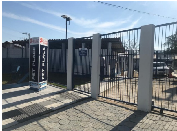
Obras receberam fiscalização do Controle Interno

Na manhã do dia 23 de julho a Secretaria Municipal de Transparência, Auditoria e Controle realizou uma visita de monitoramento às obras de reforma do Centro de Controle de Zoonoses, localizado no bairro Itacorubi.