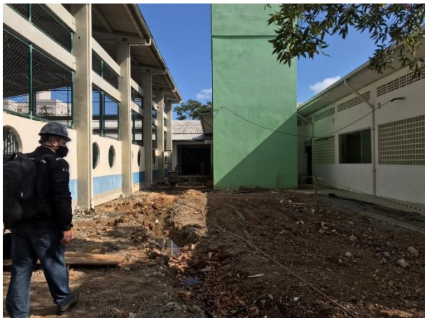
Controle Interno realizou visita de monitoramento

A Secretaria Municipal de Transparência, Auditoria e Controle (SMTAC), realizou no dia 30 de março uma visita de fiscalização as obras de reforma e ampliação da Escola Básica Municipal Alfredo Rohr, localizada na região central de Florianópolis no bairro Córrego Grande.