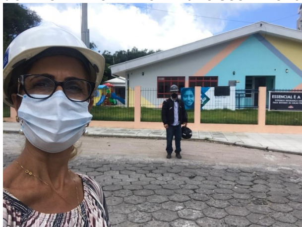
Visita à unidade foi realizada no dia 30 de março

A Secretaria Municipal de Transparência, Auditoria e Controle (SMTAC), realizou, no dia 30 de março, uma visita de monitoramento as obras de reforma e ampliação do Neim Fermínio Francisco Vieira, que está localizado no bairro Córrego Grande.