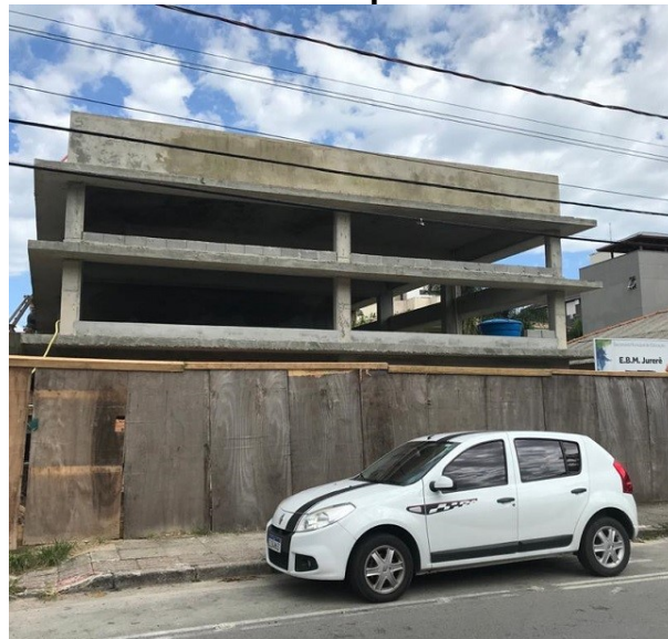
SMTAC vem acompanhando a obra da EBM Jurerê

A Secretaria Municipal de Transparência, Auditoria e Controle (SMTAC) realizou, no dia 8 de março, uma visita de monitoramento e fiscalização as obras de reforma e ampliação do Núcleo de Escola Básica Municipal Jurerê, que é localizado na Rua Jurerê Tradicional, no bairro de mesmo nome.