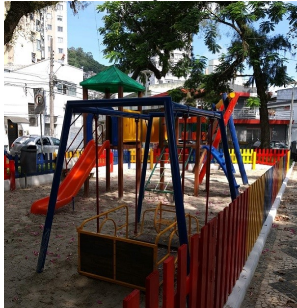
Praça Olívio Amorim fica no Centro de Florianópolis

No dia 15 de março, a Secretaria Municipal de Transparência, Auditoria e Controle (SMTAC) realizou a visita final de monitoramento as obras de revitalização da Praça Olívio Amorim, localizada na Avenida Hercílio Luz, no centro.