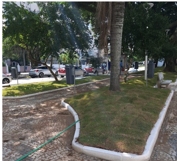
Praça Olívio Amorim fica no Centro de Florianópolis

Durante os últimos meses, a execução do contrato dessa obra foi acompanhada pelos técnicos do Controle Interno. A fiscalização do contrato de obras é uma das atribuições da SMTAC, que seleciona, por amostragem, obras e contratos do município que irão receber o acompanhamento direto do Controle Interno.