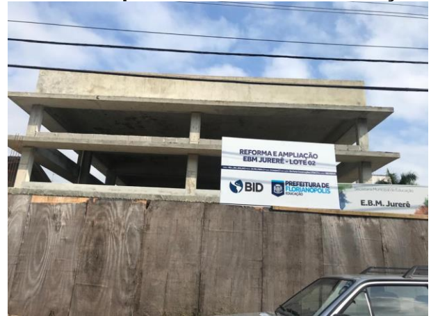
SMTAC visita obras do EBM Jurerê

A Secretaria Municipal de Transparência, Auditoria e Controle (SMTAC) realizou, no dia 20 de maio, novas visitas de monitoramento as obras de reforma e ampliação da Escola Básica Municipal Jurerê, localizada no bairro de mesmo nome e da Escola Básica Municipal Alfredo Rohr, localizada no bairro Córrego Grande.