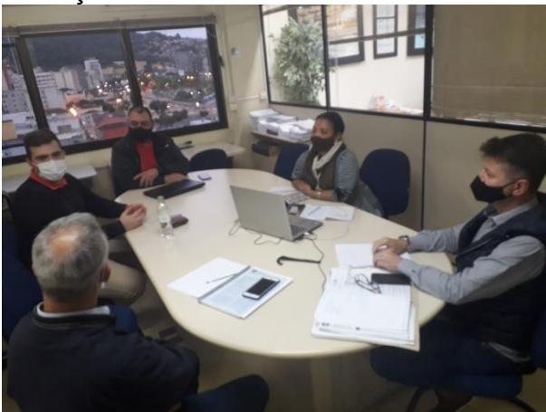
Encontro realizado no dia 11 de maio

Durante os encontros foram tratados de temas como as obrigações das comissões que fiscalizam a execução do projeto bem como o papel do Gestor da Parceria, as normativas que regem a avaliação das prestações de contas realizadas pelas OSCs e também os regramentos da Lei de Incentivo a Inovação.