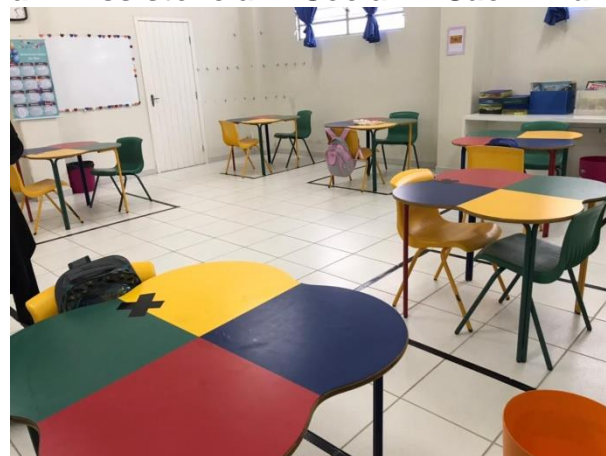
Controle Interno visitou Projeto Esperança 2021

A Secretaria Municipal de Transparência, Auditoria e Controle (SMTAC), realizou no dia 28 de maio, uma visita de monitoramento a Assistência Social São Luiz, Organização da Sociedade Civil (OSC) que atende crianças e adolescentes de seis a 15 anos em parceria com a Prefeitura.