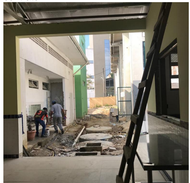
SMTAC visita obras da EBM Alfredo Rohr

Como de costume, a visita aos locais de obras foi realizada com o acompanhamento do fiscal de contrato responsável pela obra, representante da Secretaria Municipal de Educação. O objetivo do trabalho é verificar se o prazo e a execução dos trabalhos seguem em conformidade com o estabelecido no contrato.