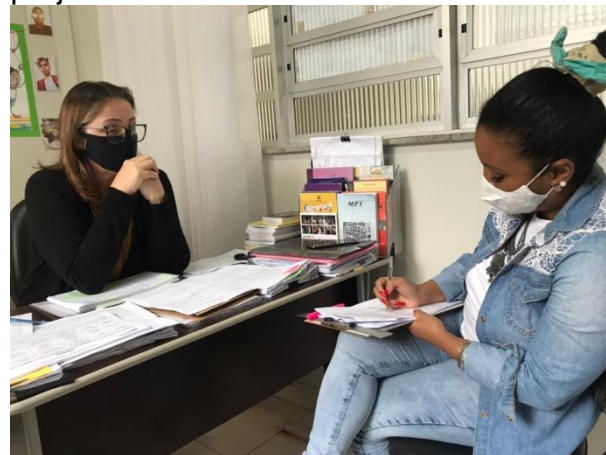
SMTAC orienta para correta aplicação dos recursos

A visita tem como objetivo monitorar e orientar no que diz respeito a aplicação dos recursos públicos recebidos pela entidade para a manutenção do projeto.