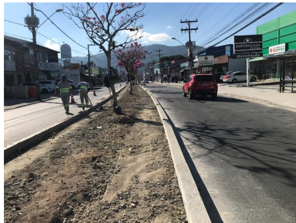
Avenida Madre Benvenuta no dia 22 de junho

A SMTAC realizou, no dia 22 de junho, uma nova visita nas obras de recuperação asfáltica e revitalização da Avenida Madre Benvenuta, localizada entre o bairro Santa Mônica e o bairro Trindade.