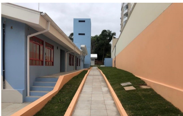
Obras estão em fase final

As visitas do Controle Interno são mais uma ferramenta de controle do município para verificação da correta execução dos contratos de obras firmados pela Prefeitura. As obras no NEIM Fermínio Francisco Vieira, que estão em fase final de execução, vão seguir sendo fiscalizadas até a sua conclusão.