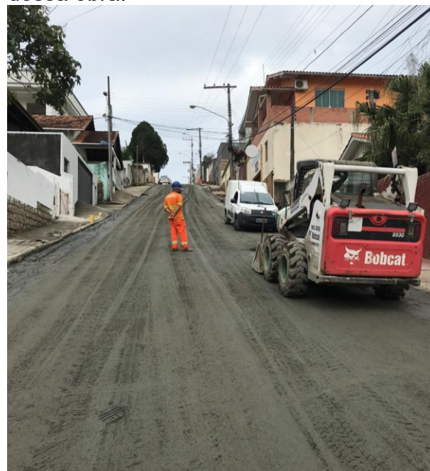
Rua João Carvalho - Agrônômica

A visita contou com a presença de um técnico do Controle Interno e um técnico da Secretaria Municipal de Infraestrutura, que é o fiscal de contrato dessa obra.