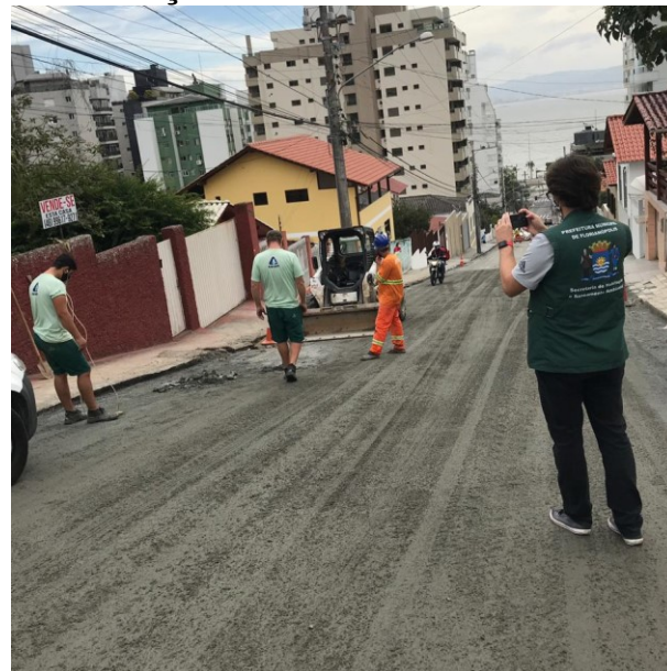
Fiscalização da obra na Rua João Carvalho

No dia 18 de junho a Secretaria Municipal de Transparência, Auditoria e Controle (SMTAC) esteve visitando as obras de revitalização da Rua João Carvalho, localizada no bairro Agrônômica.