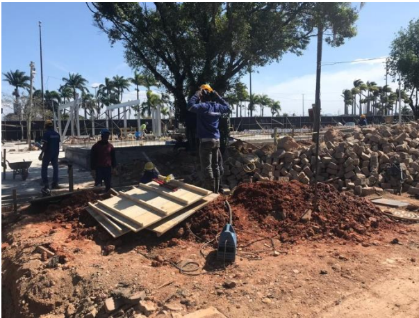
SMTAC visita obras do Largo da Alfândega

Esta é a segunda visita que o Controle Interno realiza nas obras do Largo da Alfândega. O engenheiro responsável pela fiscalização do contrato de obras acompanhou o técnico da SMTAC no monitoramento da execução das obras.