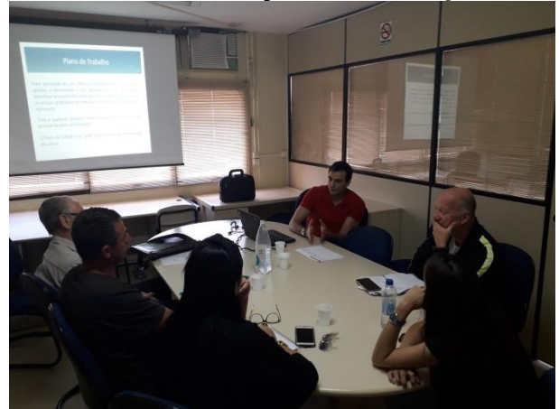
SMTAC realiza formação com entidades

A Secretaria Municipal de Transparência, Auditoria e Controle, realizou nos dias 26 e 27 de setembro encontros com Organizações da Sociedade Civil que realizam projetos oriundos de recursos provenientes de emendas parlamentares (Orçamento Impositivo).