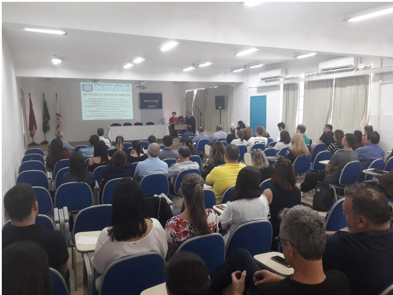
Transparência, Auditoria e Controle realizou trabalho de formação aos servidores públicos municipais

Controle Interno realiza Seminário de Formação: Diárias, Adiantamentos e Empenhos Evento reuniu cerca de 100 servidores da Prefeitura no centro de Educação Continuada