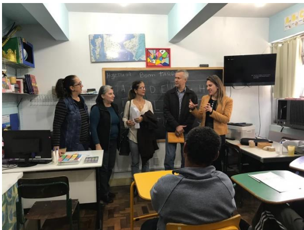
Visita a Associação de Surdos

A parceria com a Assistência Social prevê o atendimento mensal de 30 usuários do serviço, já o Público Alvo da parceria com a Educação prevê 45 pessoas surdas para a realização do projeto: Atividades Complementares em Libras para Surdos. O trabalho de monitoramento das entidades parceiras da Prefeitura é uma atribuição do Controle Interno e consta no Plano Anual de Atividades de Trabalho 2019.