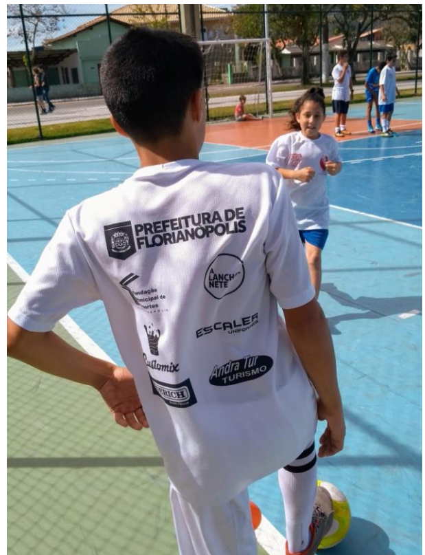
Projeto recebe monitoramento da SMTAC

Na oportunidade a equipe do Controle Interno esteve visitando as aulas de Futsal na Praça do Carianos. A modalidade é oferecida aos alunos da rede pública municipal no contraturno escolar sendo que todas as atividades são acompanhadas por professores habilitados.