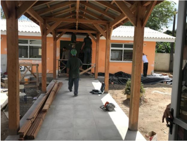
Visita às Obras na Creche Caetana

No dia 25 de setembro a Secretaria Municipal de Transparência, Auditoria e Controle realizou nova visita de acompanhamento as obras de reforma e ampliação do Núcleo de Educação Infantil Municipal Caetana Marcelina Dias, localizado na Rodovia Baldicero Filomeno no Ribeirão da Ilha.