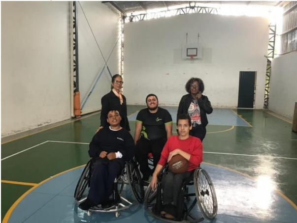
SMTAC visita projeto Basquete Sobre Rodas

A atividade, que faz parte do projeto Estimulando, Brincando e Desenvolvendo Através do Paradesporto, é fruto de uma parceria entre a Secretaria Municipal de Educação e a Entidade e prevê o repasse de, até o momento, R$ 68.581,50 no ano de 2019.