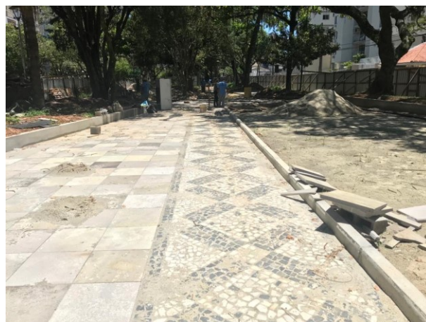
Nova visita as obras na Praça Olívio Amorim

O acompanhamento das obras através das visitas da SMTAC são mais uma ferramenta de apoio no Controle Interno do município e fazem parte do Plano Anual de Atividades de Trabalho da SMTAC no ano de 2021.