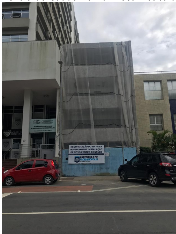
Obras receberam visita do Controle Interno

A Secretaria Municipal de Transparência, Auditoria e Controle (SMTAC) realizou, no dia 08 de janeiro, uma visita de monitoramento as obras de recuperação estrutural do Edifício Rosa Boabaid, localizado na Rua Santos Dumont, no centro de Florianópolis.