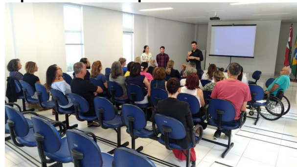
Saúde foi a primeira Secretaria a receber orientação

Com o objetivo de tornar transparente a aplicação dos recursos públicos destinados às parcerias celebradas com Organizações da Sociedade Civil (OSC), a Secretaria Municipal de Saúde realizou no último dia 13 de fevereiro um encontro para apresentar a ferramenta de gestão.