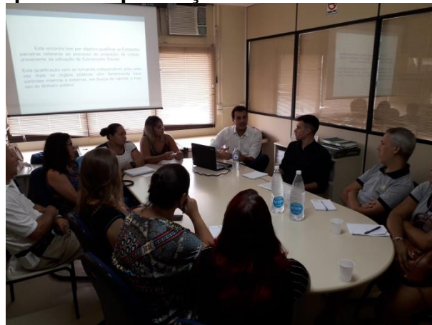
Encontro ocorreu na Transparência e Controle

A Superintendência da Transparência e Controle realizou, na última quinta-feira, 21 de fevereiro, reunião com algumas Organizações da Sociedade Civil que recebem recursos da Prefeitura, através da Secretaria Municipal de Educação. Na oportunidade o objetivo foi orientar as Entidades para a correta apresentação da Prestação de Contas dos recursos aplicados.