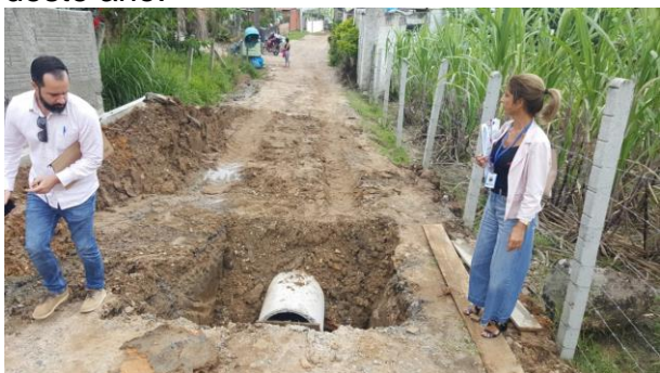
Pavimentação de Rua na Vargem Grande

A Superintendência da Transparência e Controle, juntamente com o fiscal do contrato da obra, também esteve acompanhando o andamento das obras de pavimentação e drenagem da Servidão Manoel Francisco Godinho, no bairro Vargem Grande no norte da Ilha. A obra, que iniciou em janeiro tem prazo para ficar pronta em meados de abril deste ano.