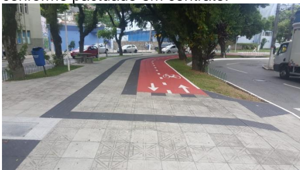
Obras fazem parte do Contrato 1099/SMI/2018

A fiscalização dos contratos de obras no município também é uma atividade exercida pelo Controle Interno, com o objetivo de verificar a correta aplicação dos gastos públicos, bem como o andamento do cronograma da obra conforme pactuado em contrato.