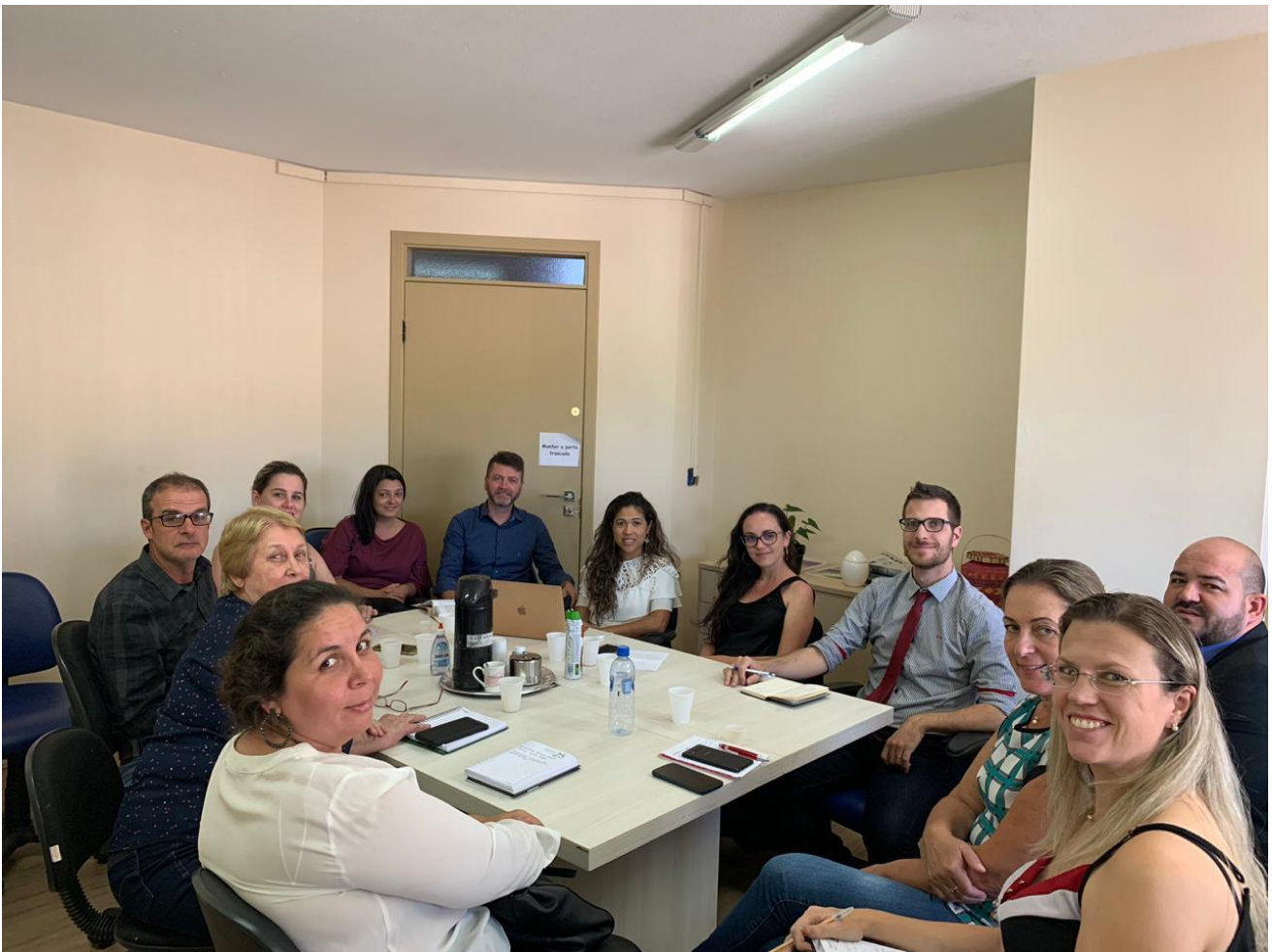
Orientação ocorreu na Secretaria Municipal de Administração

Na oportunidade foram discutidas as condições que a legislação prevê para aplicação dos recursos e a posterior apresentação da Prestação de Contas dos produtos adquiridos e serviços prestados na Unidade de Pronto Atendimento do Continente.