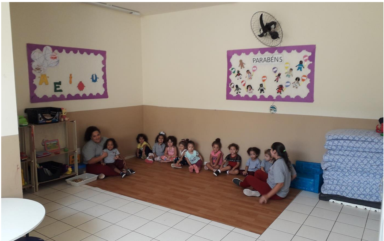
Conselho Comunitário da Coloninha atende um total de 235 crianças

O trabalho de monitoramento das entidades parceiras da Prefeitura é uma atribuição do Controle Interno e está previsto no Plano Anual de Atividades de Trabalho 2019, tendo como objetivo acompanhar o desenvolvimento das atividades descritas no Plano de Trabalho das parcerias, além de auxiliar as entidades na correta destinação dos recursos repassados, tornando mais eficiente o serviço prestado e orientando na adequada apresentação das prestações de contas.