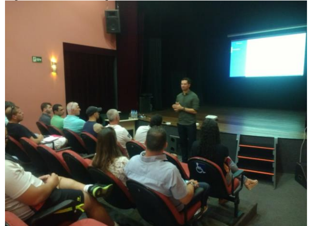
Apresentação ocorreu no Teatro da Ubro

Na manhã do dia 18 de abril, quinta-feira, a Secretaria Municipal de Transparência, Auditoria e Controle participou da reunião de apresentação e implantação da nova plataforma eletrônica de gestão de parcerias da Prefeitura para a Fundação Municipal de Esportes. O evento, que foi realizado no Teatro da Ubro, reuniu as OSCs que realizam trabalhos em parceria com a Fundação Municipal de Esportes.