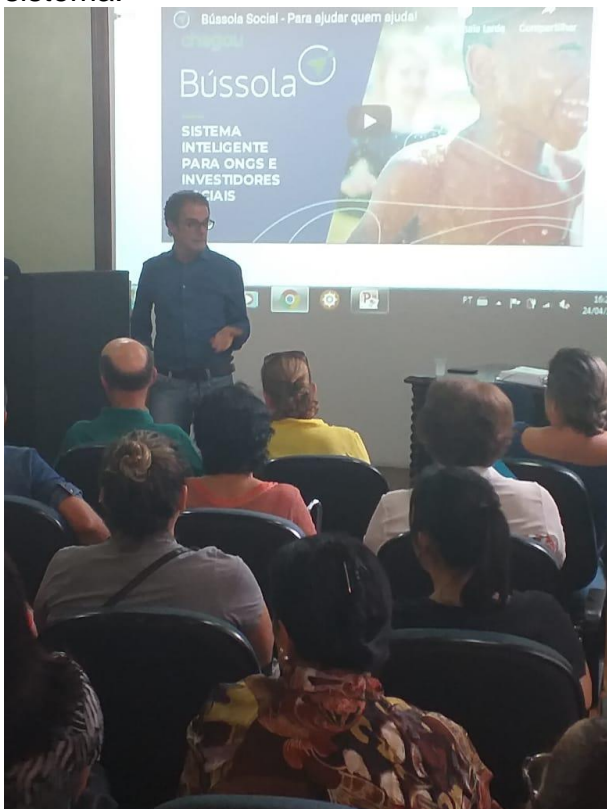
Apresentação foi realizada na Casa da Memória

Na ocasião, um técnico do Controle Interno falou sobre a importância da implantação do sistema, tendo em vista as novas ferramentas de controle e transparência que são proporcionadas pelo processo digital. Posteriormente técnicos da empresa que fornece o sistema apresentaram a nova ferramenta de gestão, explicando passo a passo como as Entidades devem realizar o cadastramento de suas atividades no sistema.