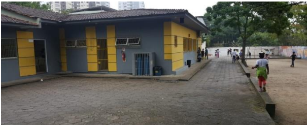
Sede da Promenor é localizada na Agrônômica

Técnicos da Secretaria Municipal de Transparência, Auditoria e Controle, deram continuidade à visita a Irmandade do Divino Espírito Santo (IDES), na tarde do dia 24 de abril, na oportunidade a fiscalização ocorreu na sede da Associação Promocional do Menor Trabalhador – Promenor, na Agrônômica.