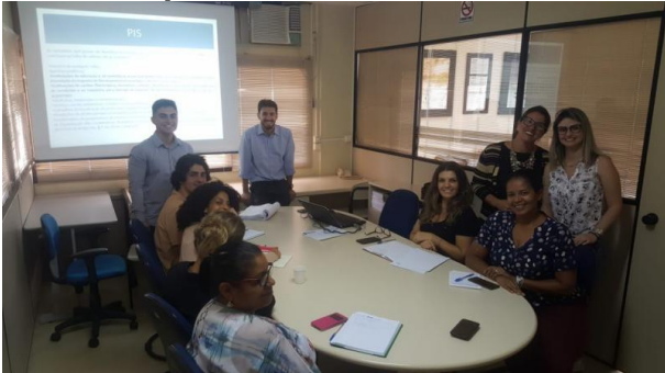
Orientação foi direcionada aos técnicos da Educação que analisam Prestações de Contas

Na tarde do dia 26 de abril, a Secretaria Municipal de Transparência, Auditoria e Controle realizou formação com os técnicos da Secretaria Municipal de Educação que analisam Prestações de Contas sobre o cálculo dos encargos sociais devidos e a respectiva análise dos comprovantes de pagamento.