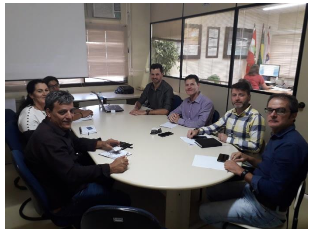
Reunião foi realizada para orientar Secretarias

Na ocasião um representante da empresa contratada esteve a disposição para o esclarecimento das dúvidas levantadas pelos participantes. Técnicos da SMTAC também auxiliaram nas informações. O Sistema de Gestão de Parcerias segue sendo implantado em todas as Secretarias e Órgãos do município, a expectativa é que até o final de 2019 todos os termos de parcerias sejam realizados 100% através do sistema.