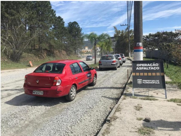
Obras na Rua Vera Linhares, Córrego Grande

A Secretaria Municipal de Transparência, Auditoria e Controle realizou um total de 42 visitas a obras durante o ano de 2019, o que dá uma média de quase uma visita por semana.