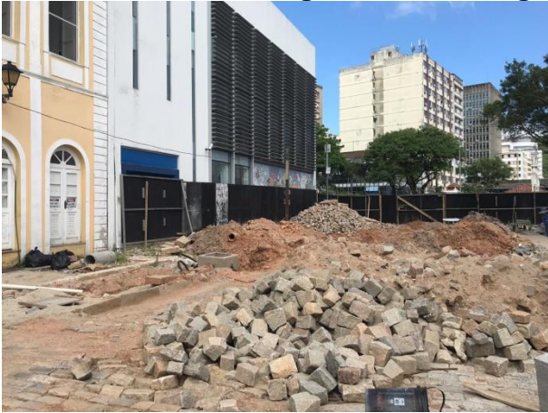
Largo da Alfandega recebe nova visita da SMTAC

No dia 11 de dezembro a SMTAC realizou uma nova visita de monitoramento as obras de requalificação urbana do entorno do Mercado Público e da Antiga Alfândega de Florianópolis.