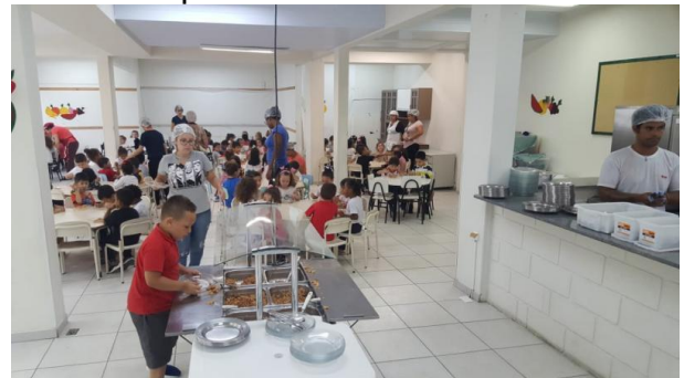
Projeto da IDES recebeu visita da SMTAC

As visitas da SMTAC têm como objetivo orientar as Entidades parceiras com a intenção de atuar preventivamente no que diz respeito a aplicação dos recursos públicos e a realização das atividades previstas.