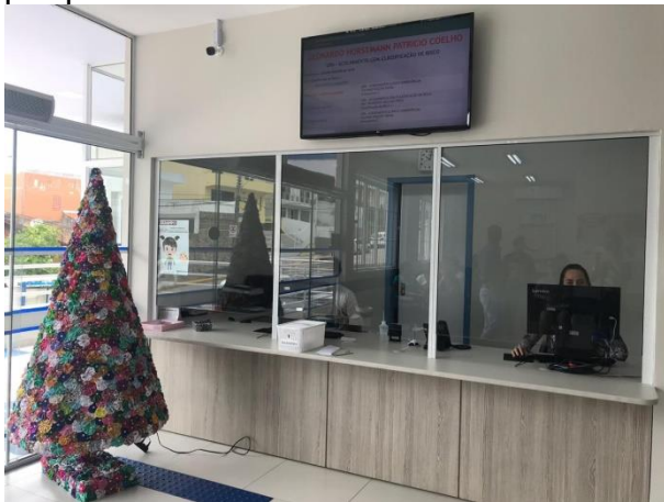
Visita de monitoramento a UPA Continente

O monitoramento da gestão da OS está previsto no Plano Anual de Atividades para o exercício de 2019, que requer o acompanhamento e a fiscalização do contrato de Gestão das Organizações Sociais bem como a emissão de relatório de acompanhamento por parte do Controle Interno.