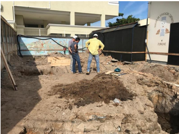
Obras no Núcleo de Educação Infantil Jurerê

O acompanhamento físico e financeiro dos contratos de obras também é uma atribuição do Controle Interno e estava previsto no Plano Anual de Atividades de Trabalho da SMTAC para o exercício de 2019.