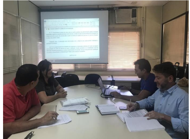
Reuniões foram realizadas durante todo o mês

No mês de dezembro, da mesma forma que nos meses de outubro e novembro de 2019, a Secretaria Municipal de Transparência, Auditoria e Controle (SMTAC) seguiu promovendo encontros com técnicos das Secretarias que realizam repasses através de subvenções sociais, auxílios e contribuições para discutir as atualizações que darão origem a um novo Decreto Municipal para regulamentar a Lei nº 13.019/2014 que trata das parcerias firmadas entre os Entes públicos e as Organizações da Sociedade Civil, com o objetivo do desenvolvimento de projetos.