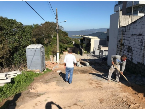
Visitas seguem sendo realizadas pela SMTAC

Além de observar todos os itens estabelecidos em contrato e a execução do cronograma da obra, durante a visita também é vistoriado a utilização dos equipamentos de proteção individual por parte dos profissionais em virtude da pandemia da Covid-19. Como sempre, o objetivo da fiscalização é estar atuando de forma preventiva.