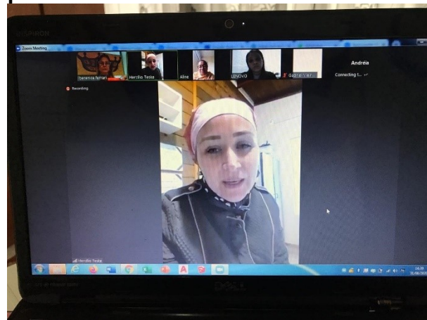
SMTAC realiza visita online a SEOVE

No dia 31 de agosto a Secretaria Municipal de Transparência, Auditoria e Controle realizou uma visita virtual a Sociedade Espírita Obreiros da Vida Eterna (SEOVE). O acompanhamento da parceria firmada entre a entidade e a Secretaria Municipal de Assistência Social teve que ser realizado neste formato em virtude da SEOVE atender idosos, que estão no grupo de risco da Covid-19.