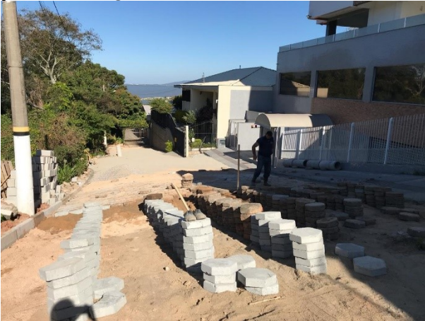
SMTAC realizou visitas em ruas no Morro da Caixa

No dia quatro (4) de agosto a Secretaria Municipal de Transparência, Auditoria e Controle realizou visitas a uma série de ruas que estão recebendo obras de pavimentação e drenagem no Morro da Caixa, localizado na região continental do município.