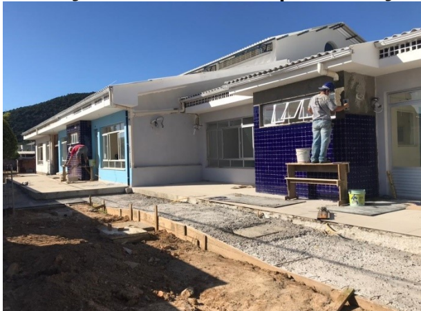
Controle Interno realizou visita de monitoramento

A Secretaria Municipal de Transparência, Auditoria e Controle (SMTAC), realizou no dia 29 de março uma visita de fiscalização as obras de reforma e ampliação do Núcleo de Educação Infantil Municipal (NEIM) Armação, localizado no bairro da Armação do Pântano do Sul.