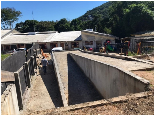
SMTAC visita obras do NEIM Vila Cachoeira

No dia 28 de abril, a Secretaria Municipal de Transparência, Auditoria e Controle (SMTAC) realizou nova visita de monitoramento as obras de reforma e ampliação do Núcleo de Educação Infantil municipal Vila Cachoeira, localizado no bairro Saco Grande.