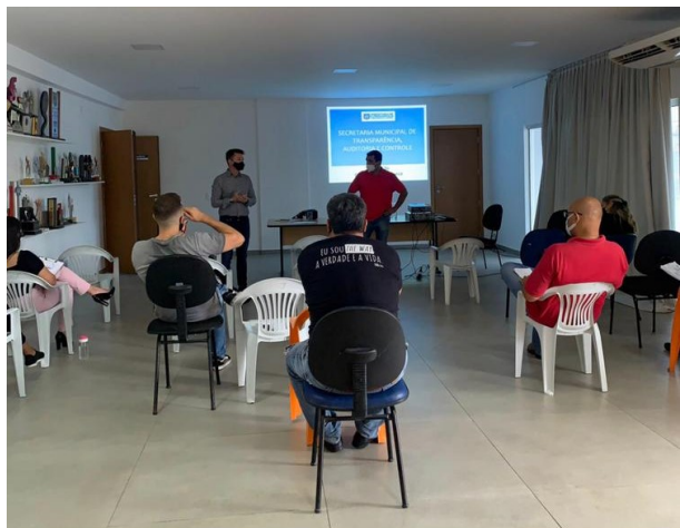
Formação realizada com FME e FFC no dia 16 de abril

Na oportunidade a SMTAC esteve orientando os técnicos que trabalham diretamente com as parcerias e que são os responsáveis pela análise das Prestações de Contas destes recursos repassados.