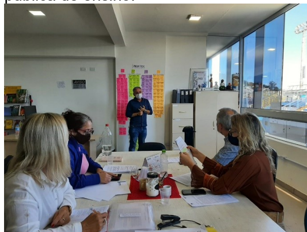
SMTAC orientou comissão da FFC

Os encontros serviram para a equipe alinhar como irá proceder nas fiscalizações da execução da contrapartida que os 35 espaços culturais beneficiários do programa terão de realizar através de atividades culturais destinadas para a rede pública de ensino.