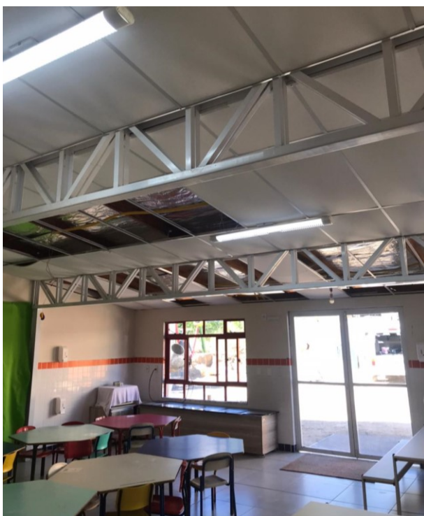
SMTAC visita obras do NEIM Vila Cachoeira

A visita, realizada em parceria com a Secretaria Municipal de Educação, representada pelo fiscal de contrato responsável pela Obra, teve como objetivo verificar se a execução dos trabalhos segue em conformidade com o estabelecido no contrato.