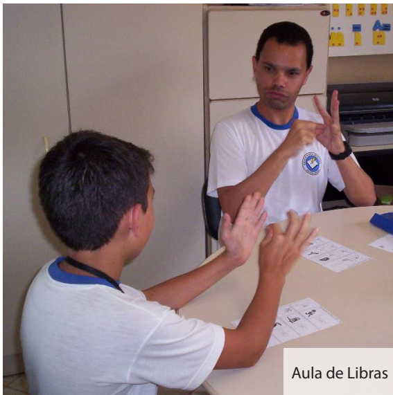
Aula de Libras