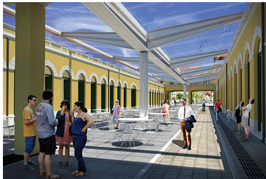
Os trabalhos para a instalação da cobertura retrátil do vão central do Mercado também foram iniciados.

Até o fim deste mês, os comerciantes da Ala Sul estão instalando suas estruturas para iniciar o atendimento ao público na reabertura marcada para o dia 05 de agosto.