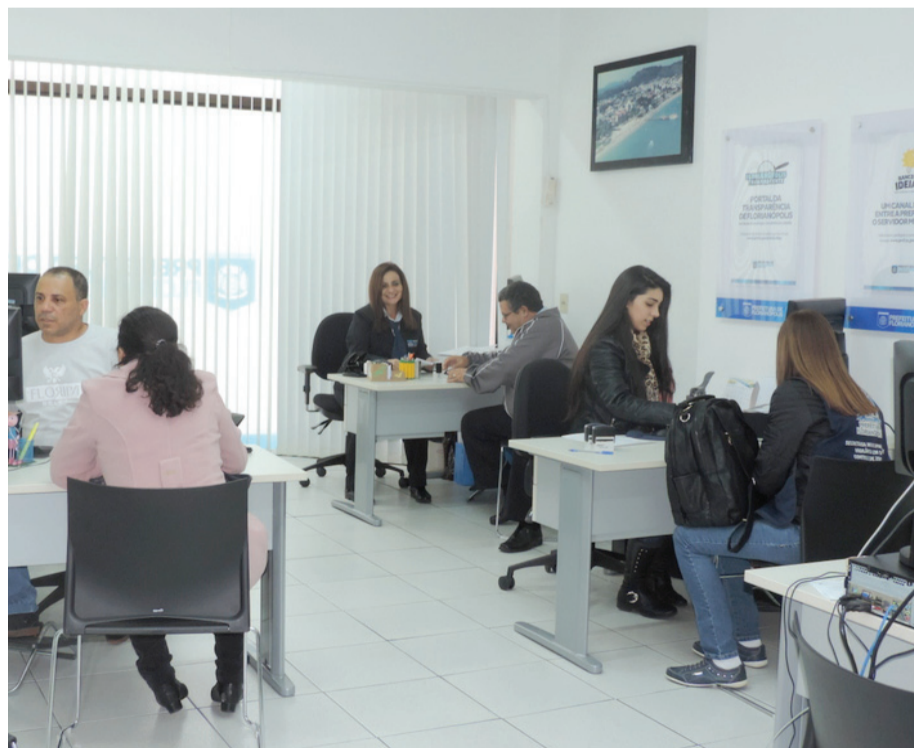
Em média a Central atende 70 servidores por dia

A Central de Atendimento do Servidor inaugurada em outubro de 2014 realizou um grandioso número de atendimentos funcionais no primeiro semestre deste ano.