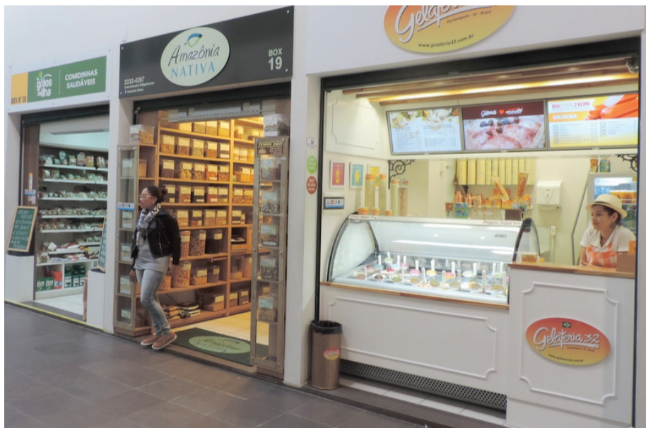
Onde antes eram vendidos apenas calçados agora existem dezenas de atividades comerciais diferenciadas

A primeira estrutura entregue à população, denominada Ala Norte, reabriu em junho de 2014, com a proposta de combinar atividades comerciais tradicionais e modernas, sem deixar de lado a autenticidade e o caráter popular do espaço.