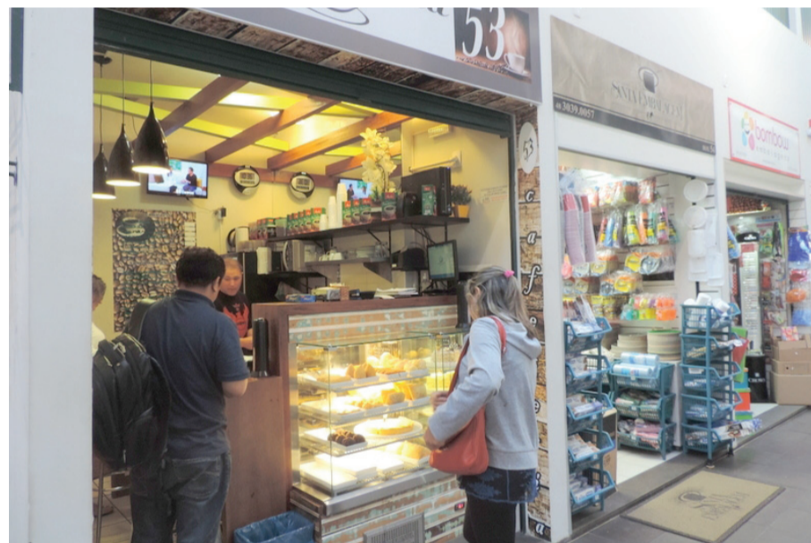
A Ala Norte tornou-se mais atrativa aos moradores e turistas.

E assim, o novo Mercado Público de Florianópolis vai tomando nova forma, e estará funcionando 100% na alta temporada!