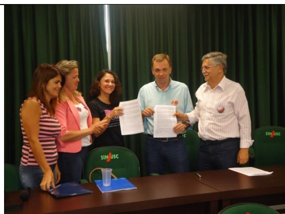
Assinatura da Carta Compromisso pelos Candidatos