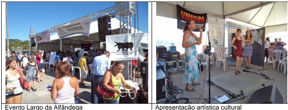
Evento Largo da Alfândega