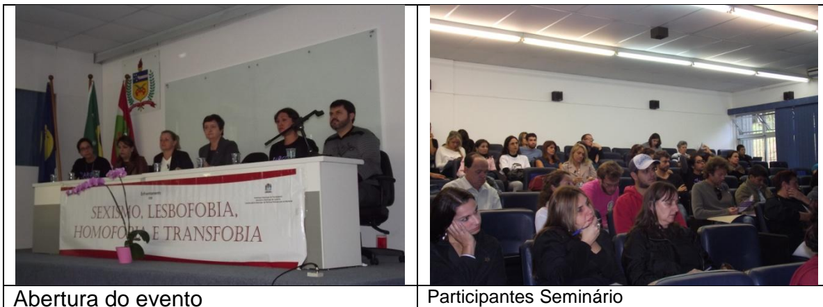
Abertura do evento