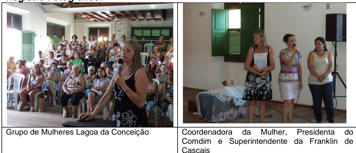
Grupo de Mulheres Lagoa da Conceição