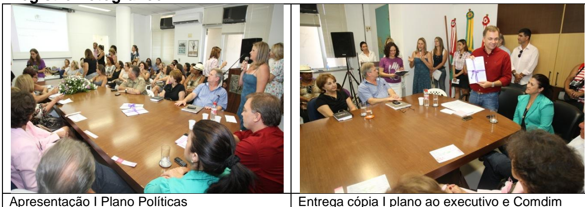
Apresentação I Plano Políticas