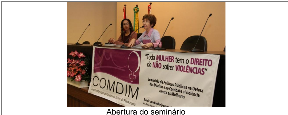
Abertura do seminário