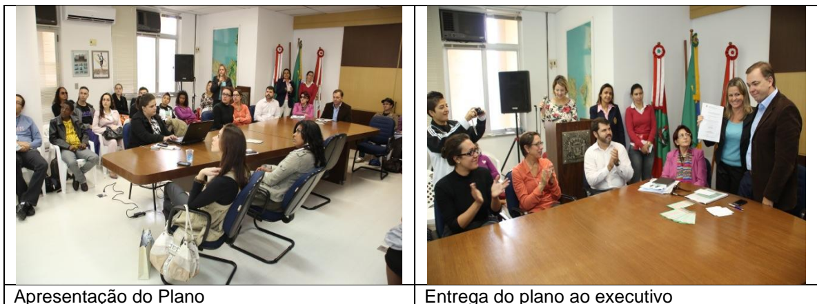
Apresentação do Plano