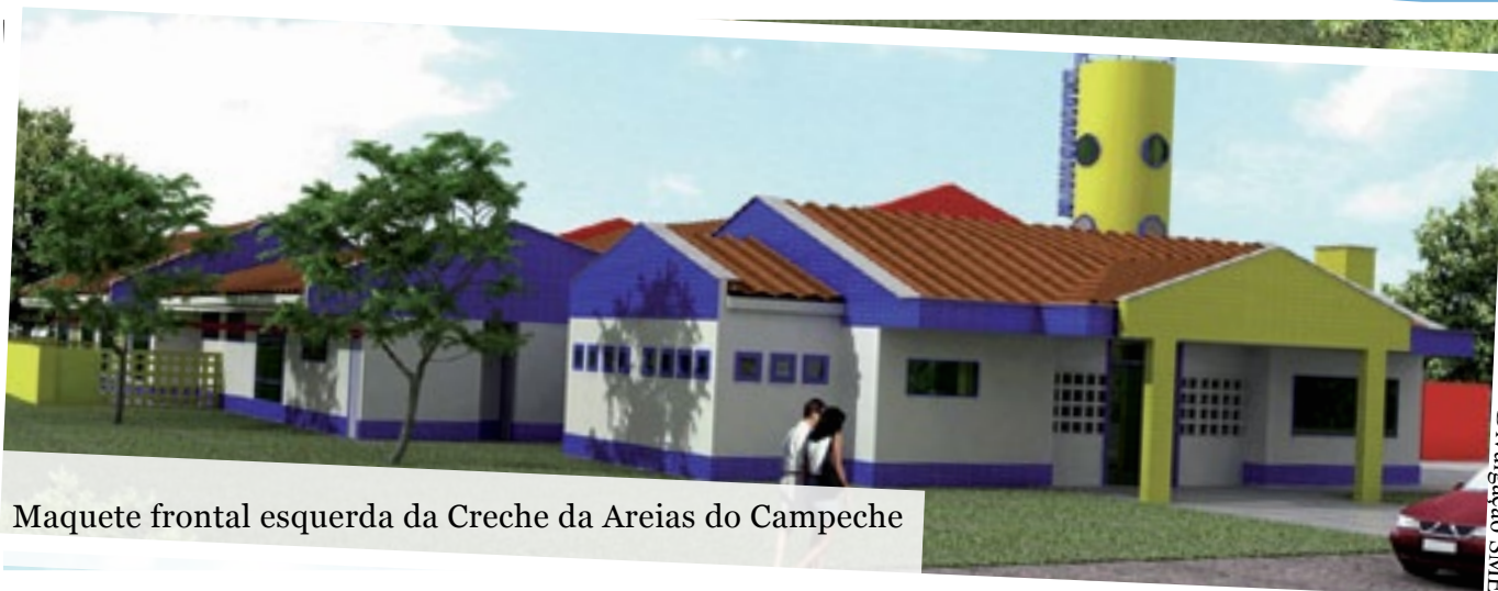
Maquete frontal esquerda da Creche da Areias do Campeche

A creche, que atenderá crianças de zero a seis anos, receberá o nome do Poeta João da Cruz e Sousa, que foi o maior simbolista do Brasil.