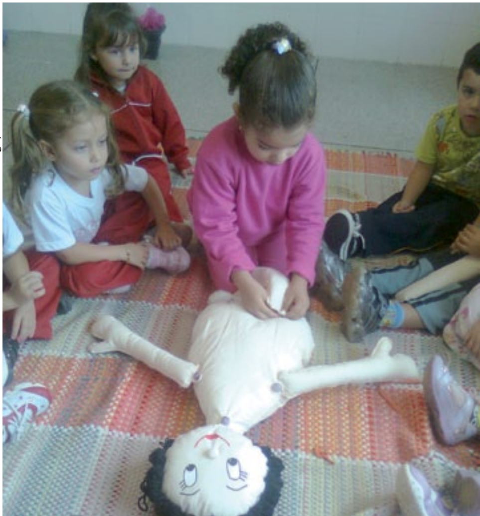
O brinquedo é usado para trabalhar as relações de afetividade, cuidado, respeito com os colegas, higiene e alimentação