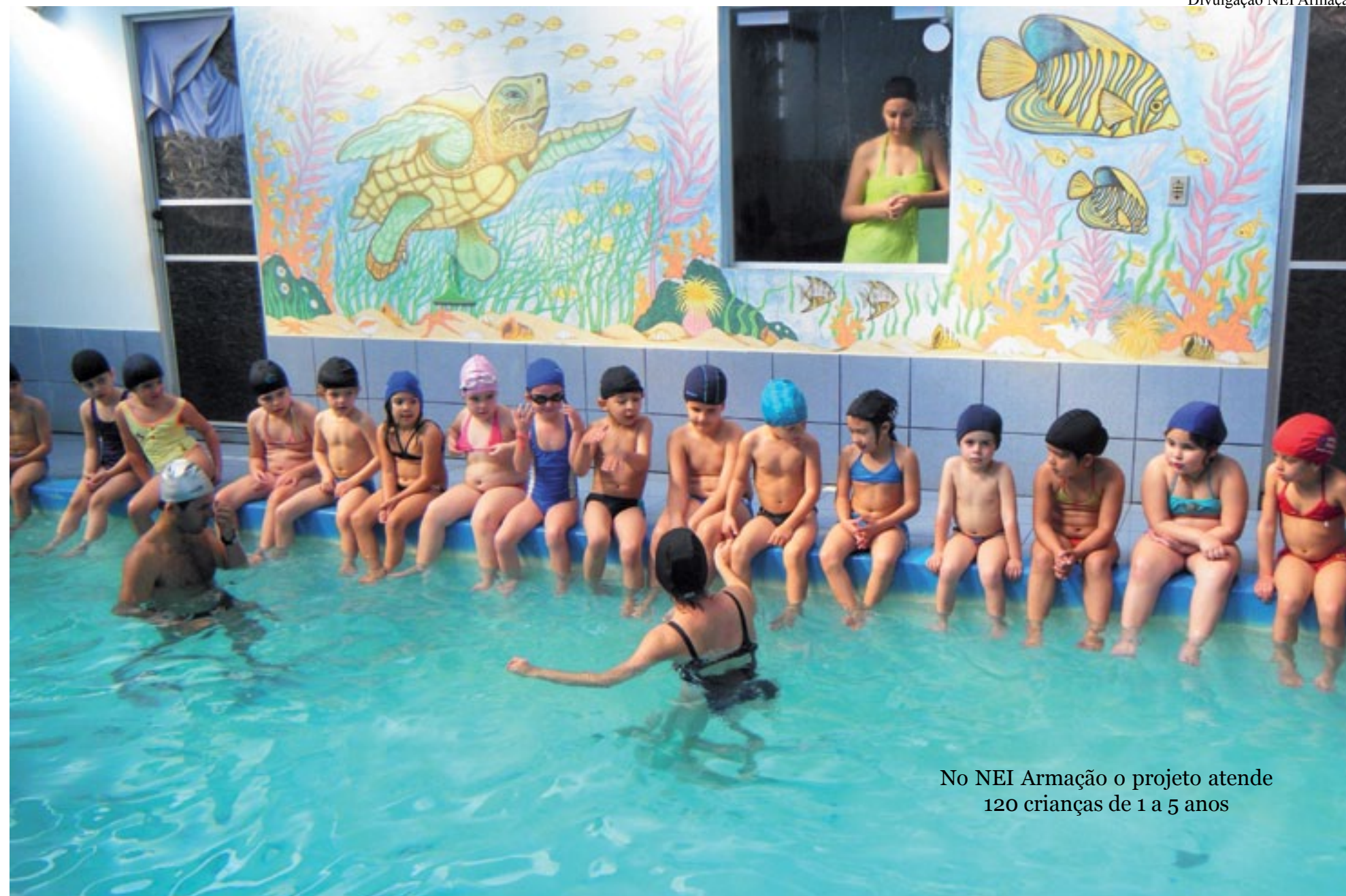
No NEI Armação o projeto atende 120 crianças de 1 a 5 anos