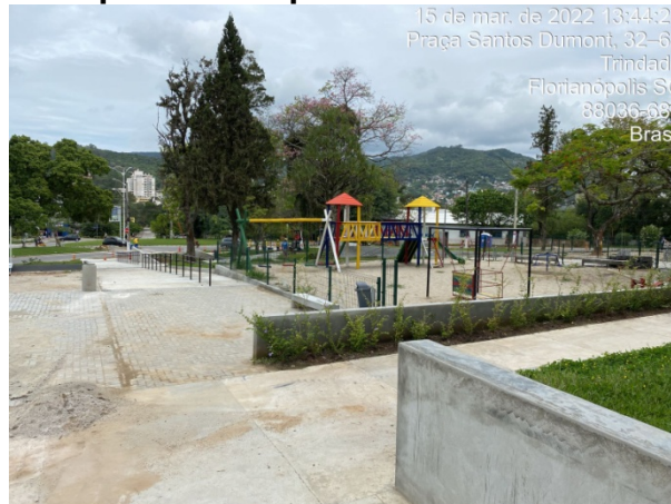
SMTAC monitorou obras da Praça Santos Dumont

A Secretaria Municipal de Transparência, Auditoria e Controle (SMTAC) esteve presente acompanhando as obras de revitalização da Praça Santos Dumont, localizada no bairro Trindade, durante toda a sua execução.