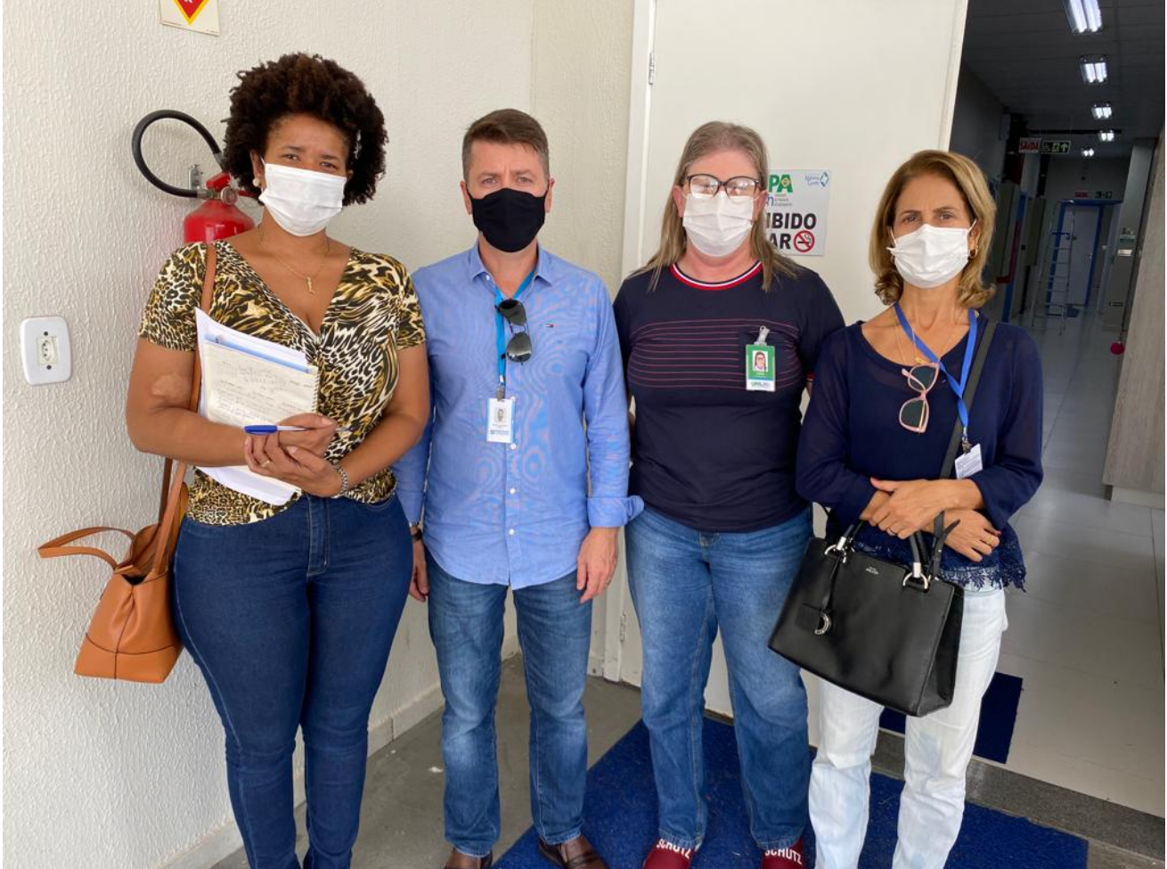
Controle Interno realizou fiscalização na UPA Continente

Técnicos da Secretaria Municipal de Auditoria, Transparência e Controle realizam visita de monitoramento e avaliação a Unidade de Pronto Atendimento do Continente