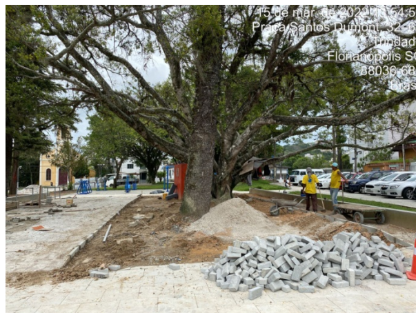
Obra já foi entregue ao Município

O trabalho de monitoramento e fiscalização de obras do município é realizado por um engenheiro do Controle Interno sempre acompanhado do representante da Unidade Gestora responsável pela obra e tem como objetivo estar atento ao cronograma dos trabalhos, bem como identificar possíveis melhorias.