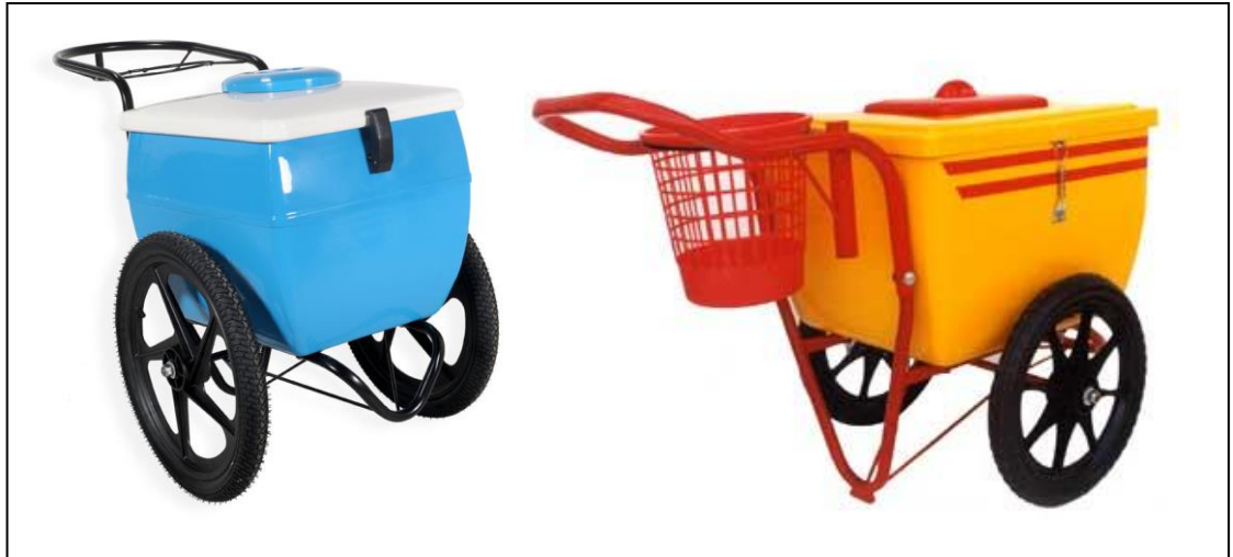
Figura 1 - Exemplos de carrinho de picolé.

O carrinho de picolé deve apresentar boas condições para uso.