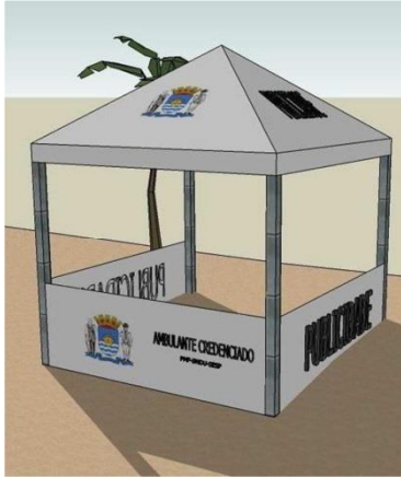
AMBULANTE CREDENCIADO PMF - SSP - SUSP